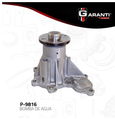
P-9816 BOMBA DE AGUA