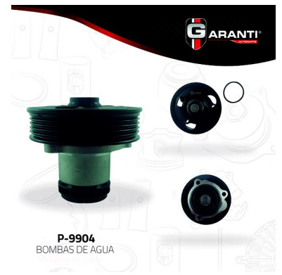
P-9904 BOMBAS DE AGUA