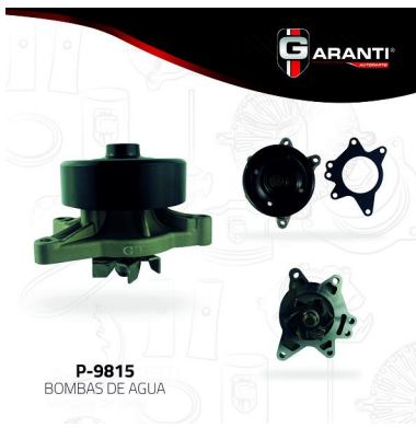
P-9815 BOMBAS DE AGUA